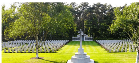
Een eerbetoon dat voortleeft Stichting Adoptiegraven Mierlo